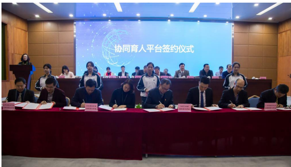
协同育人平台签约仪式

(七) 2018年1月4日上午,广东城建职教集团第一届理事会第二次会议在学校会议中心第一报告厅隆重召开。正誉企业管理(广东)集团股份有限公司成为广东城建职教集团副理事长单位,并与校方签订了“企业财务管理协同育人平台”合作协议书。