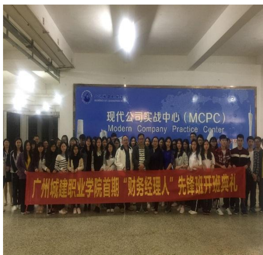
“财务经理人”班开班典礼

(三) 2017年4月，广州城建学院首期“财务经理人”创新创业先锋班开班，该班有二门课程由正誉公司二位兼职教师授课。该合作在双师队伍建设和大学生创新创业方面有着极大的促进作用。