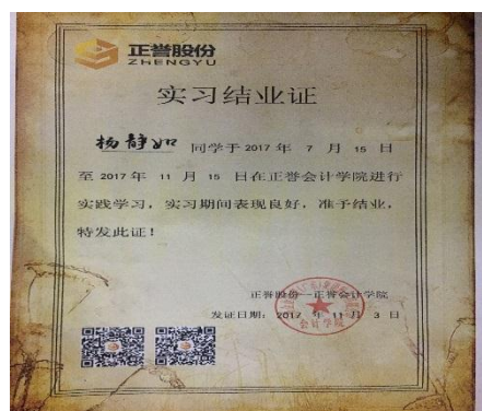
学员实习结业证书