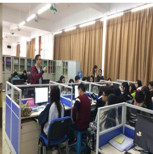
企业教师现场授课