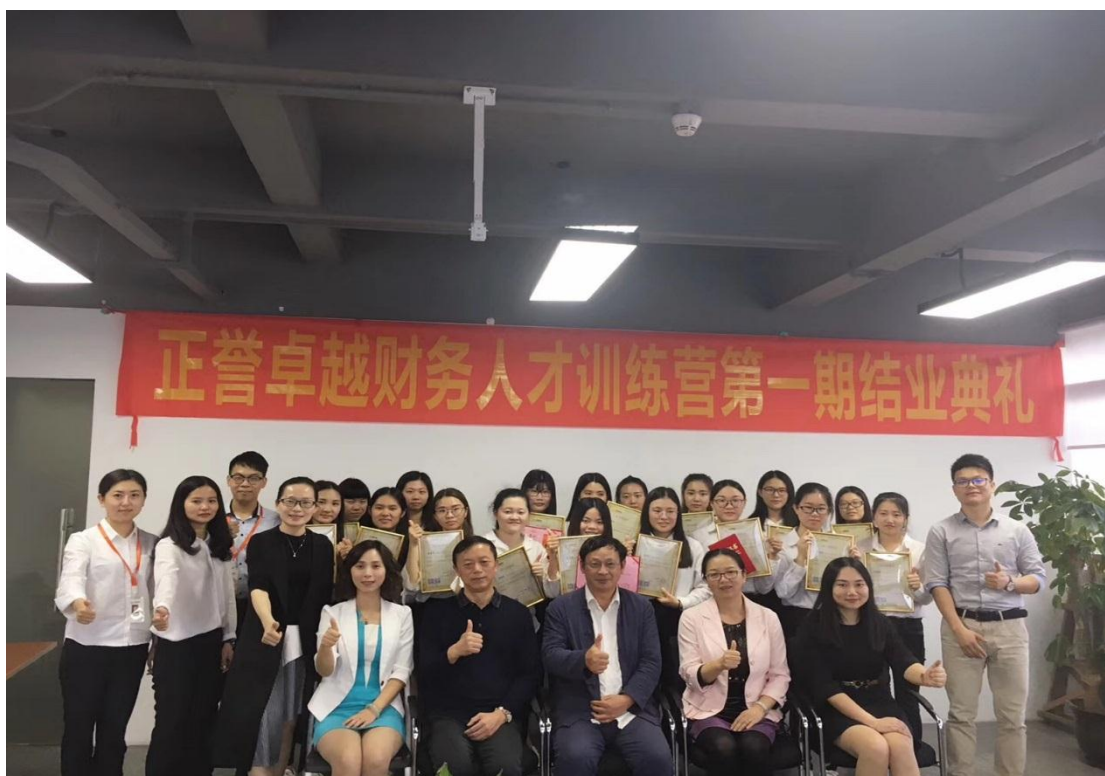
第一期卓越财务人才训练营结业典礼